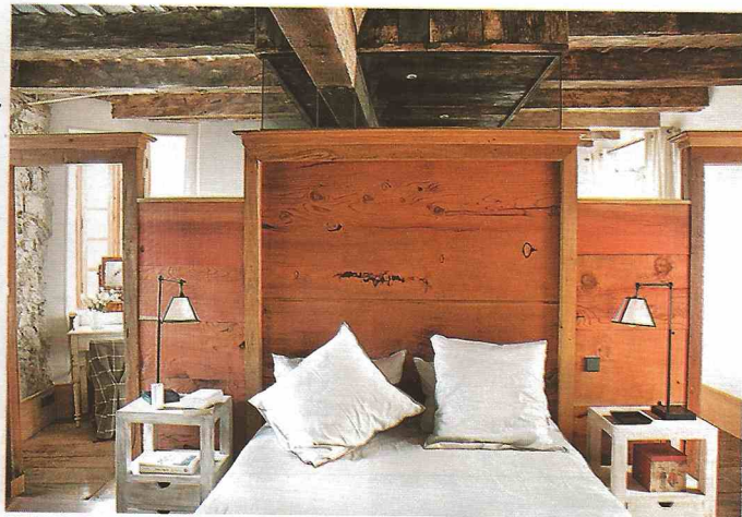
Esprit chalet avec cette cloison en bois, qui sert à la fois de séparation et de tête de lit.

Un coin lecture agencé sous la pente du toit avec un lit en fer forgé en guise de banquette et une malle ancienne pour table basse.